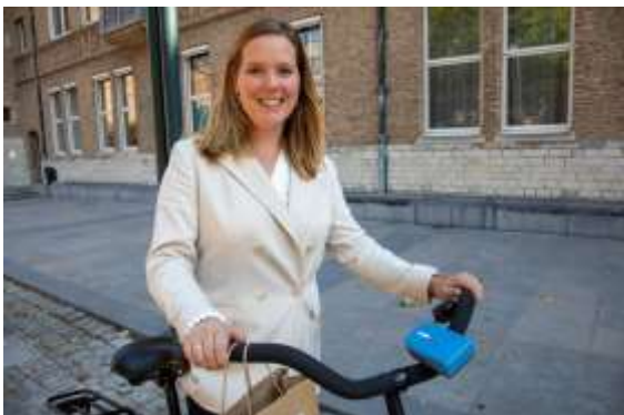
Provincie Zeeland stimuleert 'snuffelfietsen voor het meten van de luchtkwaliteit

De Provincie zet zich in voor vraagstukken op regionaal schaalniveau. We voeren wettelijke taken uit ten aanzien van bedrijven waar de provincie het bevoegde gezag voor is. Ook pakken we de coördinatie op bij vraagstukken die op regionale schaal impact hebben op het milieu. Verder nemen we het initiatief om samenwerking tussen alle benodigde partners tot stand te brengen. ‘