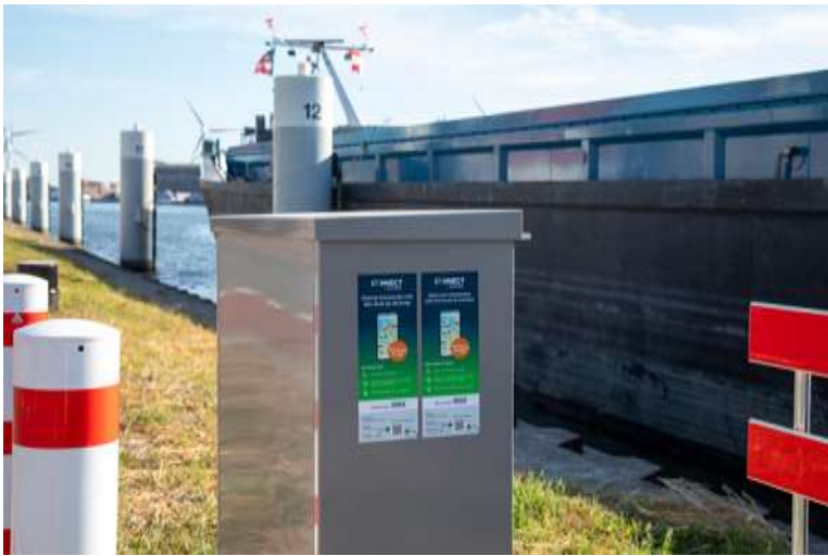
Walstroom Kanaal Gent-Terneuzen