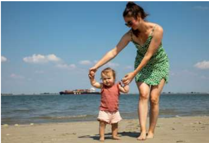
Provincie, het Rijk en Vlaanderen werken samen om PFAS in de Westerschelde terug te dringen