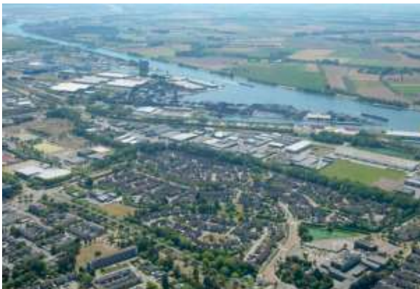
Sluiskil en Kanaal Gent-Terneuzen