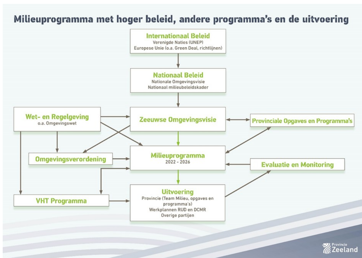
Figuur 4: de plaats van het Milieuprogramma in het internationaal, nationaal en provinciale beleid.