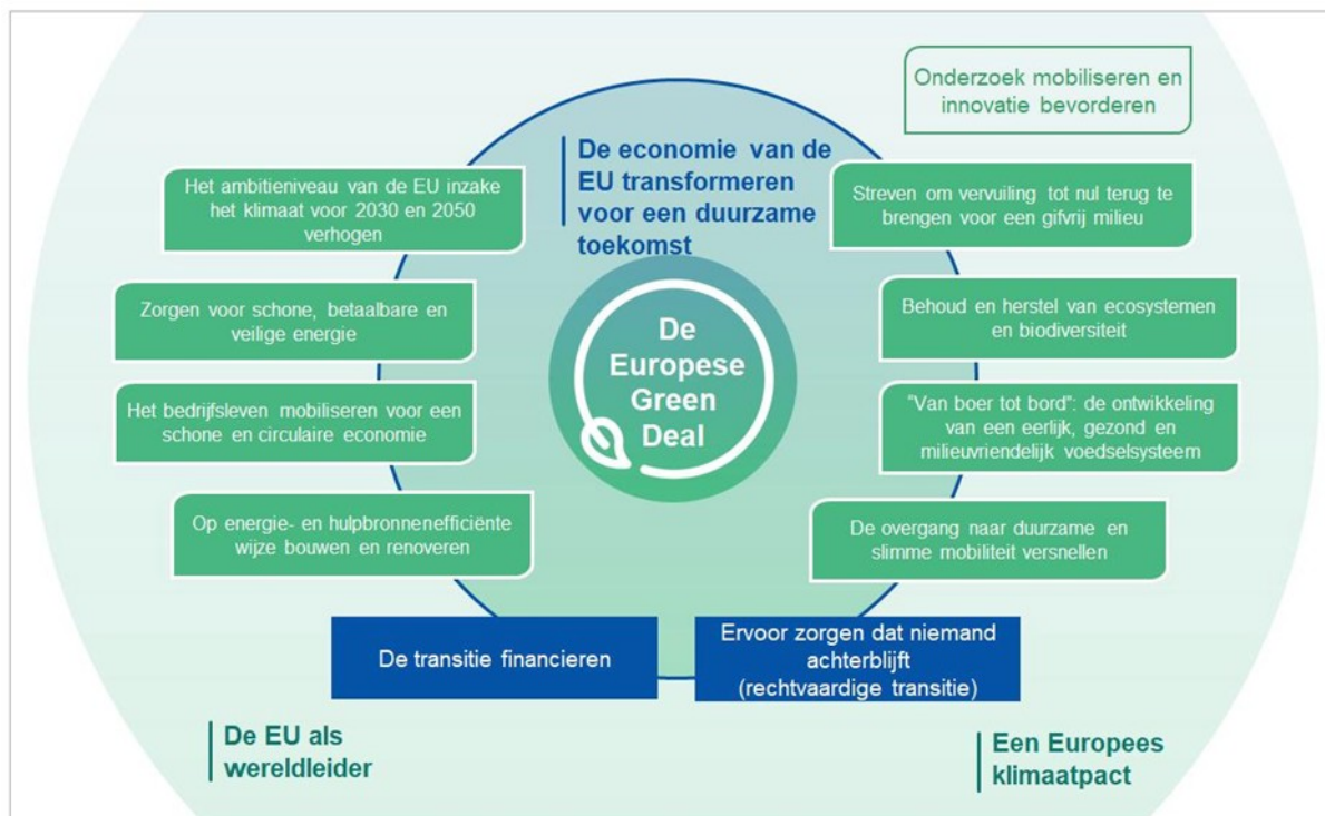
Figuur 3: de Europese Green deal met deelprojecten