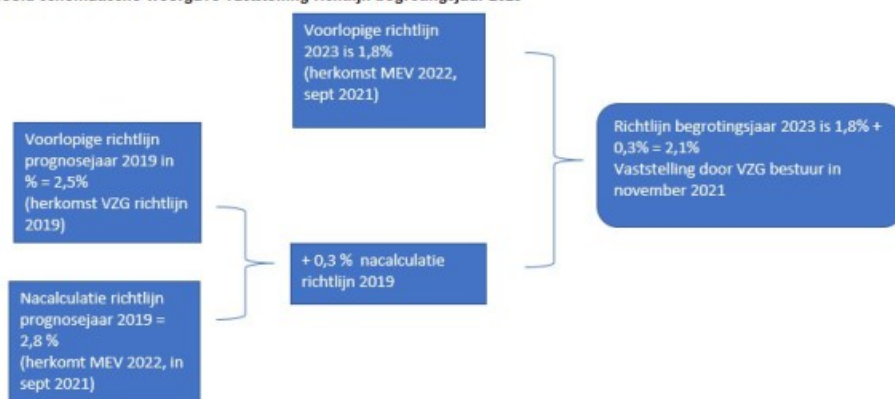
Figuur 3.1 schematische weergave nieuwe systematiek VZG-richtlijn met nacalculatie. 7

Het uitgangspunt voor deze berekening blijft de septembercirculaire van het Ministerie van Binnenlandse Zaken en Koninkrijksrelaties. Dit maakt de richtlijn nog steeds goed controleerbaar.