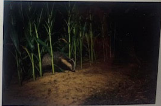
Schade aan een maisveld door een das

De nieuwe overeenkomsten gaan per 1 november 2023 in. Voor agrariërs kan dit betekenen dat men met een andere organisatie in contact komt dan voorheen. De overeenkomsten met de nieuwe taxatiebureaus zijn tot stand gekomen na een Europese aanbesteding begin 2023. De huidige taxatiebureaus Wiberg Taxaties en Van Ameyde Waarderingen blijven een deel van de faunaschade voor BIJ12 taxeren. Wie welke faunaschade gaat taxeren is hieronder te zien: