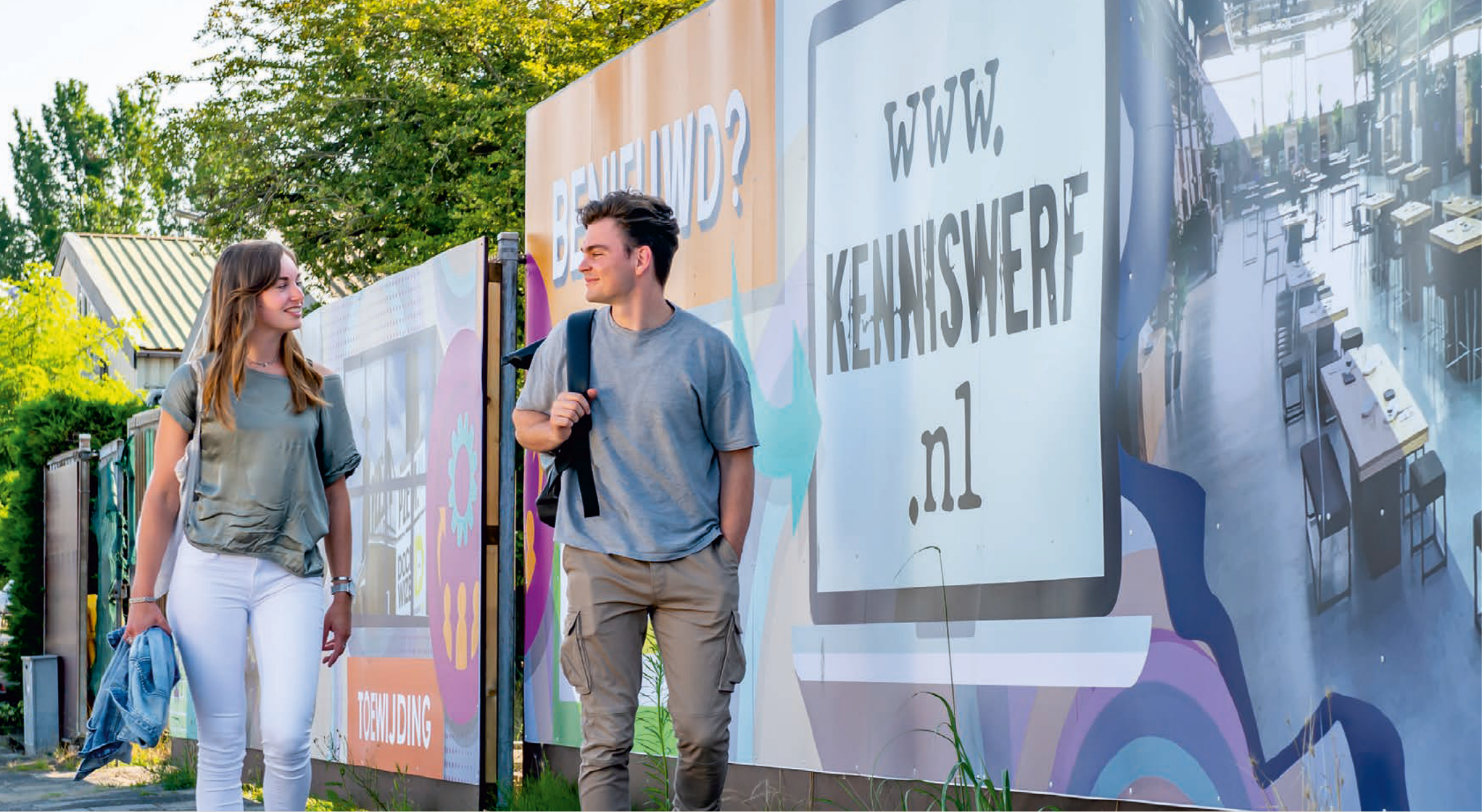
FICHE D: Fysieke ontwikkeling Kenniswerf Vliissingen