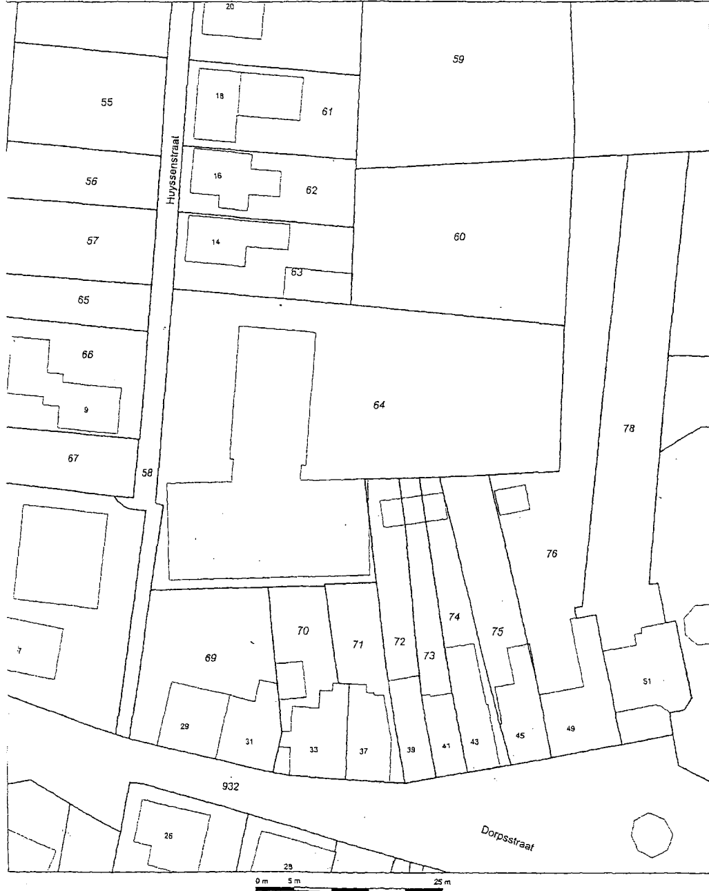
Uitbrekkel Kadastrale Kaart