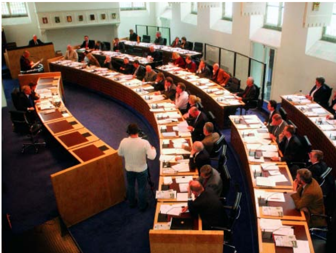
Vergadering van Provinciale Staten.

Over deze dossiers hebben de commissarissen van de Koningin een gezamenlijke mening gevormd. En op enkele dossiers heeft dat belangrijke resultaten opgeleverd. Zo is in het dossier crisisbeheersing mede dankzij de inspanningen van met name commissaris van de Koningin in de provincie Groningen, de heer Alders, begin 2006 een doorbraak bereikt. De commissarissen van de Koningin behouden tijdens regionale rampen en crises hun doorzettingsmacht als de bestuurders er onderling niet uitkomen.