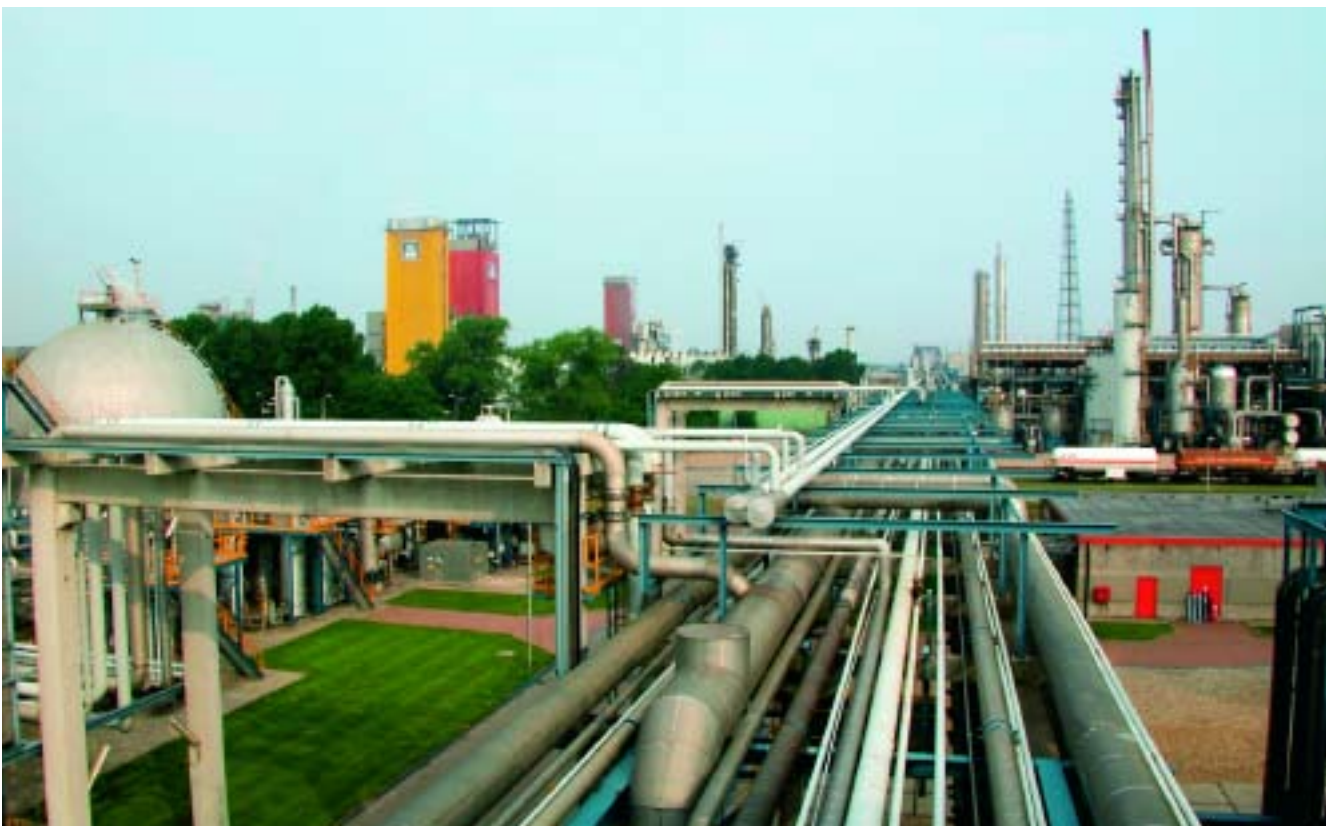
YARA Sluiskil.