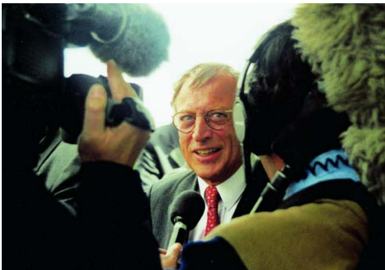
Interview met de pers.

Voor u ligt mijn dertiende jaarverslag. Hierin doe ik u verslag van mijn werkzaamheden en activiteiten in 2005. Het accent ligt daarbij, net als in voorgaande jaren, op onderwerpen als mijn voorzitterschap van de Kring van de commissarissen van de Koningin, burgemeestersaangelegenheden, gemeentebezoeken, het Koninklijk Huis en representatie. En veel aandacht zal ook dit jaar weer uitgaan naar openbare orde en veiligheid.