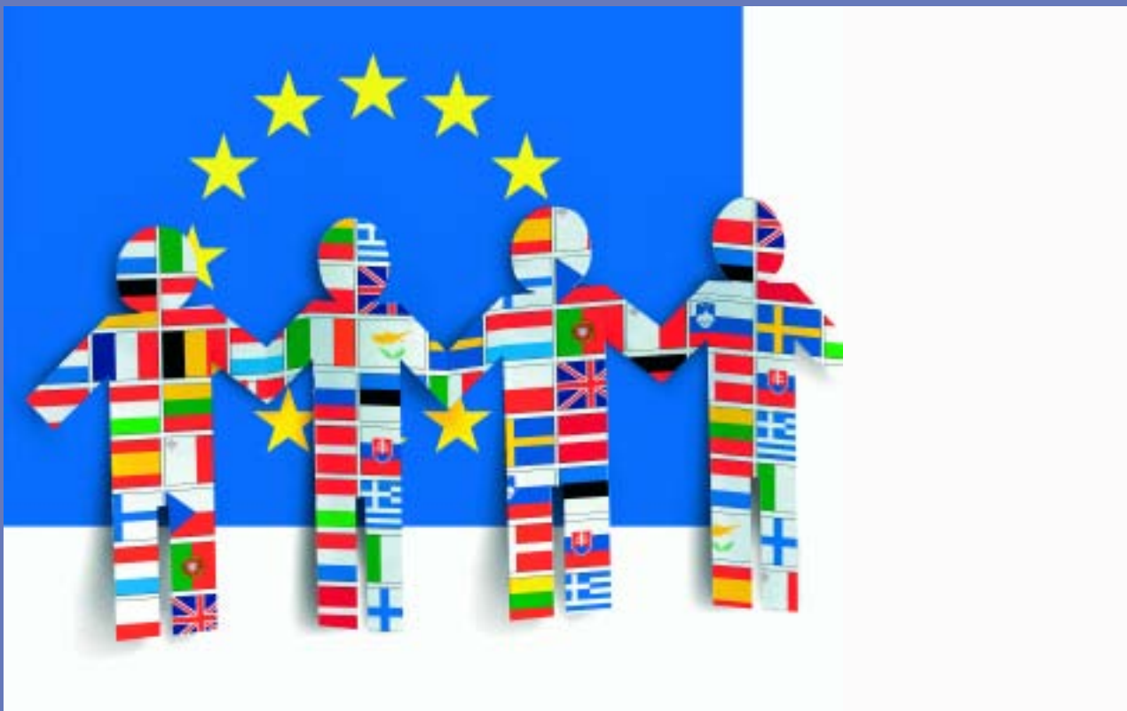
De Europese vlag en de vlaggen van de lidstaten van de Europese Unie.

Het besef leeft dat de regio's een centrale rol vervullen bij de uitvoering van Europese programma's en de toepassing van Europese wetten en regels. Het zijn de regio's die het Europese beleid realiseren en succesvol kunnen maken. En niet voor niets zijn het meestal Gedeputeerden, vertegenwoordigers dus van lokale overheden, die Europese projecten trekken. De invloed van Europa in de regio's is groot. Zo is ruim driekwart van alle provinciale milieuwetgeving gebaseerd op wetten en regels die uit Brussel afkomstig zijn.