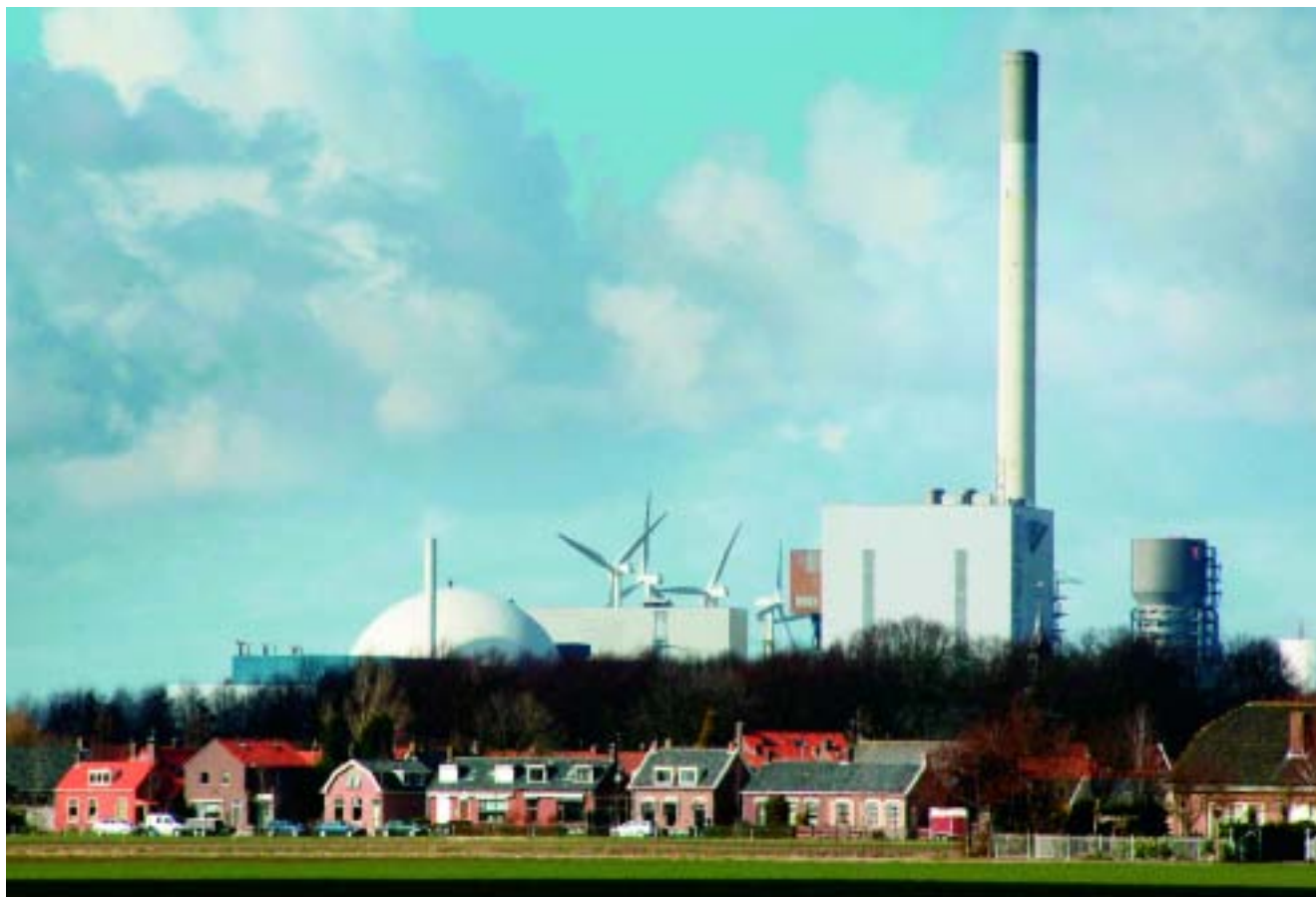
Kerncentrale Borssele.

Voor het realiseren van het gemeentelijk rampenplan is een model-rampenplan opgesteld. Dit model is door alle gemeenten gehanteerd en op de lokale omstandigheden afgestemd.