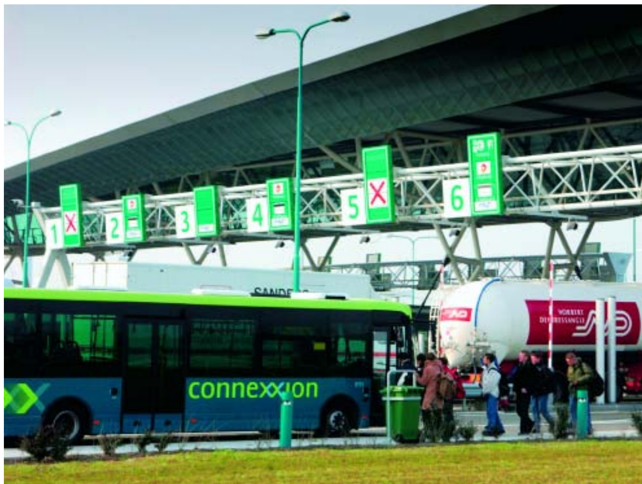
Tolplein Westerscheldetunnel.

Uit het periodiek overleg tussen de veiligheidsplatforms van West-Vlaanderen, Oost-Vlaanderen en Zeeland zijn in 2005 de nodige initiatieven ontplooid en is de bestaande samenwerking gecontinueerd.