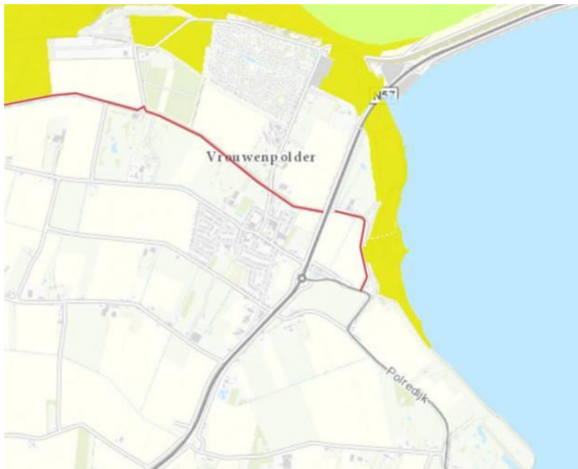
Figuur 1: ligging perceel binnen begrenzing Natura 2000-gebied Manteling van Walcheren

Uw perceel ligt inderdaad binnen de begrenzing van Natura 2000-gebied Manteling van Walcheren, zie kaartje hieronder. Ik denk dat het goed is om een afspraak te maken dat wij hierover eens met elkaar in gesprek gaan. Dan kan ik u uitleggen hoe het precies zit en kunt u mij uitleggen wat uw plannen met het perceel zijn. Is dat wat u betreft een goed idee? Zo ja, dan ontvang ik graag van u een aantal data en tijd voorstellen, zodat we een geschikte dag kunnen plannen.