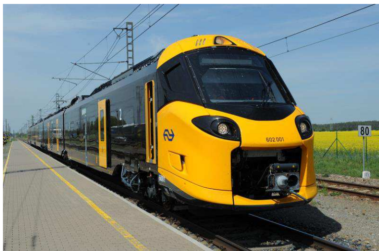
ICNG "de Wesp", met 200 km per uur naar Middelburg?

Bij drie treinen per uur heeft 1x per uur Middelburg - Breda v.v. meer kans van slagen met de ca. 60 passagiers die dan gemiddeld per trein via station Middelburg reizen en ook omdat het traject Middelburg - Breda ca. 40 km korter is, waardoor lagere exploitatiekosten. Imagoschade door "proef mislukt" moet worden voorkomen.